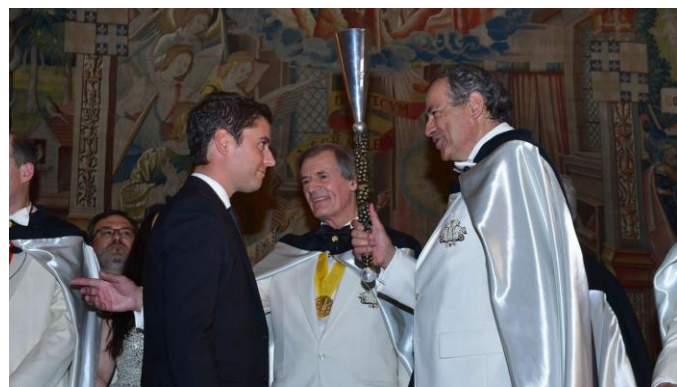
Le 7 juin 2019, Gabriel Attal était intronisé officier d'honneur de l'Ordre des Coteaux de Champagne, au Palais du Tau, à Reims.

Cette intéressante révélation nous vient de la CGT du Champagne ( voir le site CGT du champagne ). Avant de devenir Premier Ministre, le jeune Gabriel ATTAL a été distingué, le 7 juin 2019, en devenant officier d'honneur de l'Ordre des Coteaux de Champagne lors du « Grand chapitre de la Fleur de Vigne » (on est prié de ne pas rire), institution qui entend défendre l'image du champagne à travers le monde.